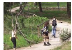
un tratto "off road"

Programma & Percorso: Ritrovo alle ore 09,00 alla sorgente del Mincio e partenza un'ora dopo. Ci sono tre opzioni di percorso: Lungo (fino ai pressi di Mantova e ritorno). Medio (fino al Borghetto e ritorno). Breve , direttamente all'arrivo nel centro storico di Ponti sul Mincio, un suggestivo paesino medioevale. Qui ci attenderà una grandiosa tavolata alla sagra di S.Gaetano famosa negli ambienti gastronomici per la prelibatezza delle specialità culinarie mantovane, (consigliata da "Slow Food") che lo scorso anno ha rifocillato i concorrenti fino allo "strafogamento" per la gioia di tutti.